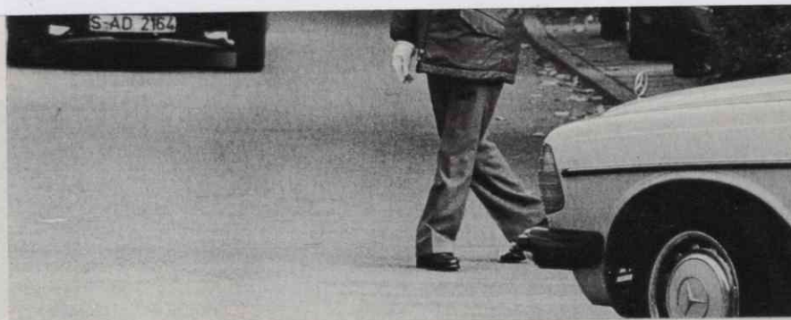
Polizei-Freiwilliger bei Verkehrsregelung: 5,85 Mark je Einsatzstunde