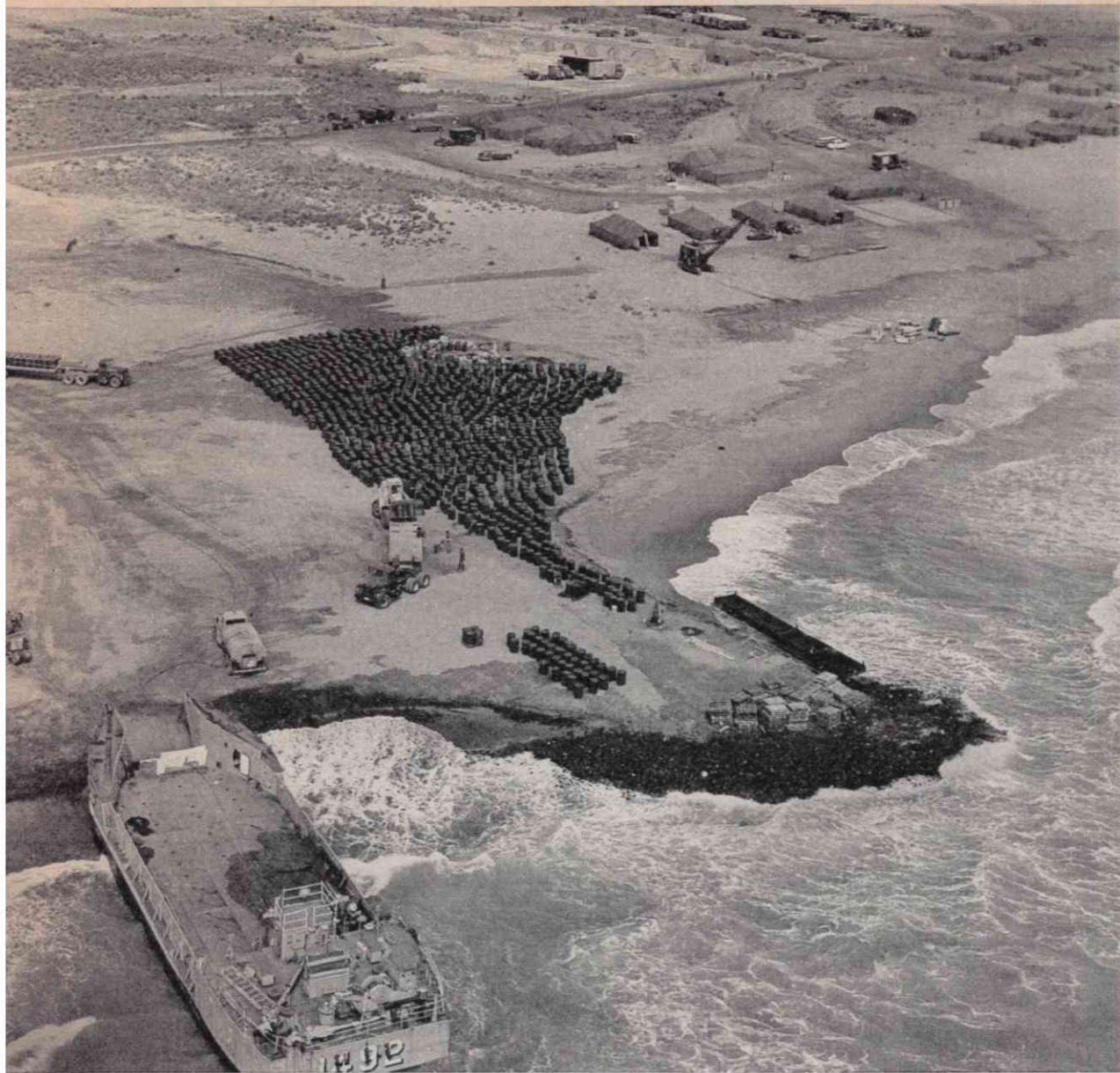
Auf Spanien sind bereits Wasserstoffbomben gefallen — nach dem Zusammenstoß zweier US-Flugzeuge im Jahr 1966. Beim Aufprall der Bomben wurde weite Gebiete durch Plutonium verseucht. US-Truppen trugen über 1750 Tonnen Erdreich ab und transportierten es in Fässern auf eine nukleare Abfallhalde in South Carolina

nordvietnamesische Hauptstadt Hanoi mit Atombomben zu vernichten, wenn die politischen Verhandlungen über einen Waffenstillstand platzen sollten.